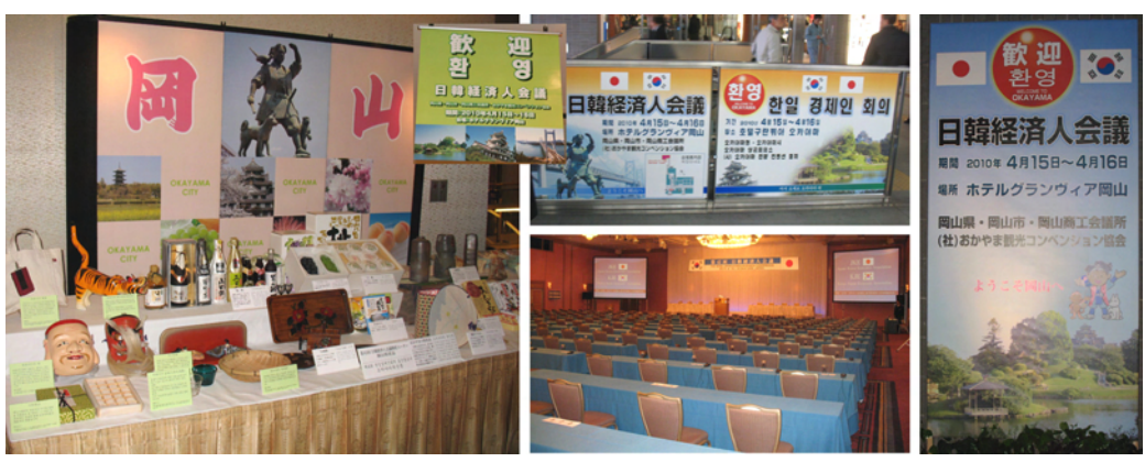
회의장(호텔 그란비아 오카야마) 전경과 환영 포스터들