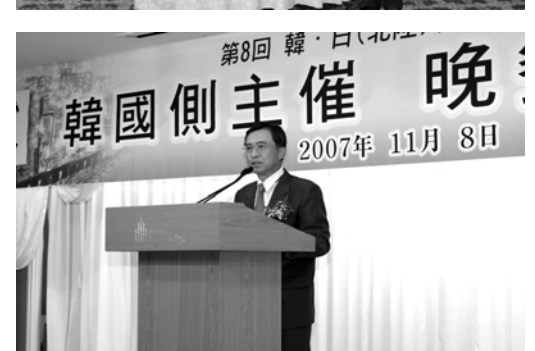
□ 한·일(北陸)기업간 상담회, 세미나(11.8)