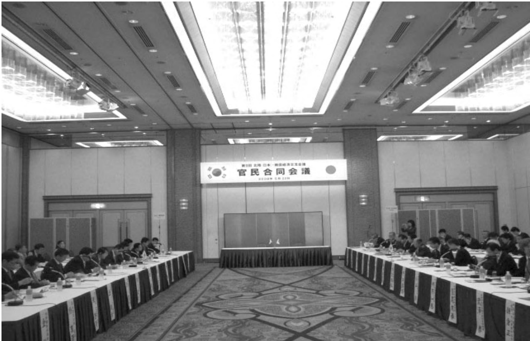
□ 제9회 한·일(北陸) 경제교류회의 민관합동회의(5.22)