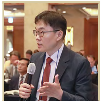
박상준 와세다대학 교수