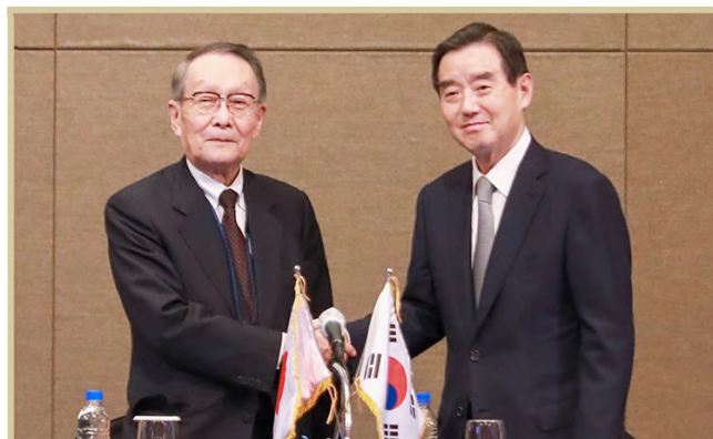
◀ 악수하는 양국 단장