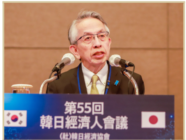
아이보시 코이치 주대한민국일본국특명전권대사