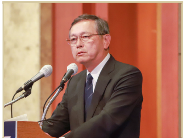
사이키 아키타카 미쓰비시상사(주) 이사 / 前 일본외무성사무차관