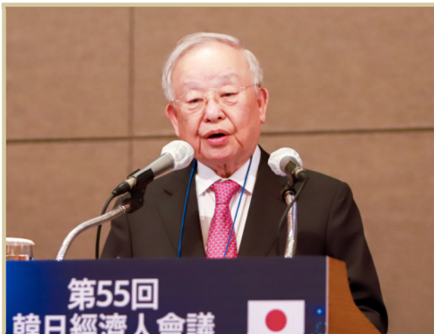
손경식 한국경영자총협회 회장 / CJ그룹 회장