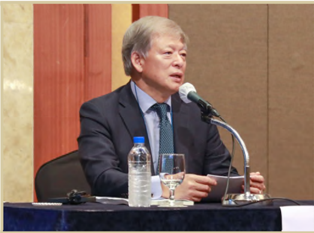
〈좌 장〉 염재호 태재대학교 초대총장