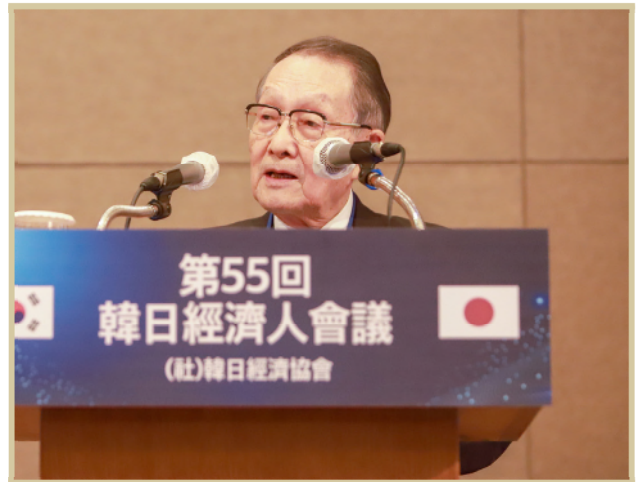
사사키 미키오 일한경제협회 회장