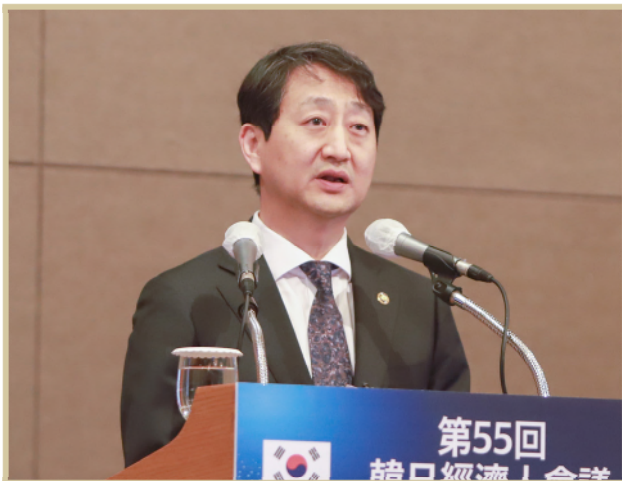
안덕근 산업통상자원부 통상교섭본부장