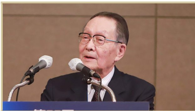
사사키 미키오 일한경제협회 회장