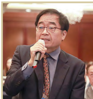
사공 목 산업연구원 연구위원