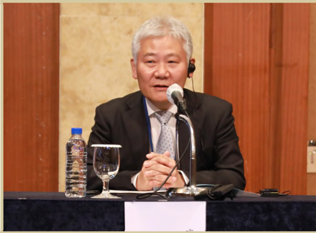
〈좌 장〉이데이시 타다시 NHK 해설주간