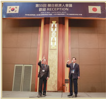
양국 단장 건배 제의