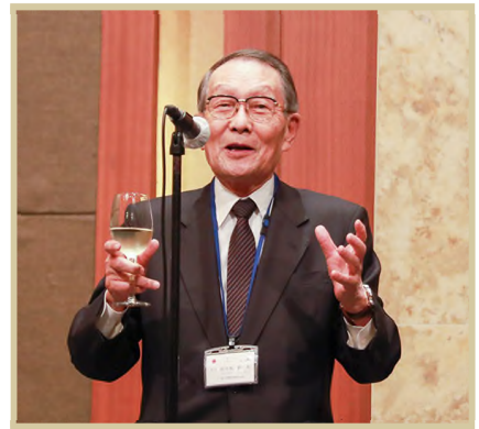
사사키 미키오 일한경제협회 회장