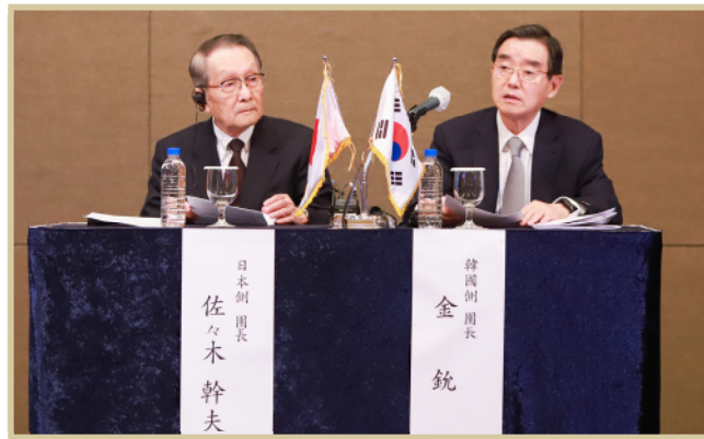
◀ 양국 단장 폐회식 진행 모습