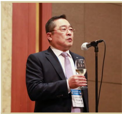
구자열 한국무역협회 회장