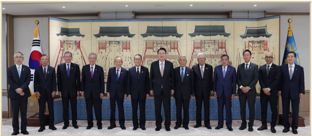
윤석열 대통령이 15일 서울 용산 대통령실 청사에서 한일경제인회의의 일본 대표단과 기념촬영.