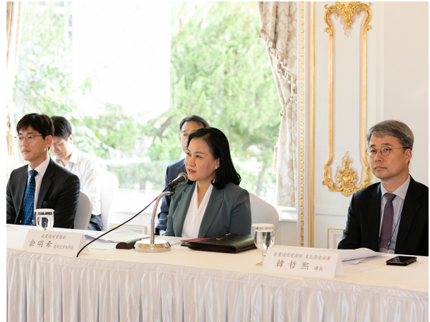
유명희 산업통상자원부 통상교섭본부장 예방