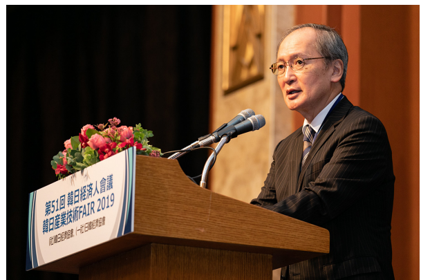
나가미네 야스마사 주한일본대사