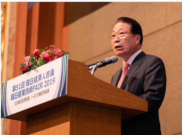
(특별강연) 유명환 前외교통상부 장관