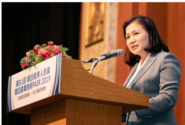
유명희 산업통상자원부 통상교섭본부장