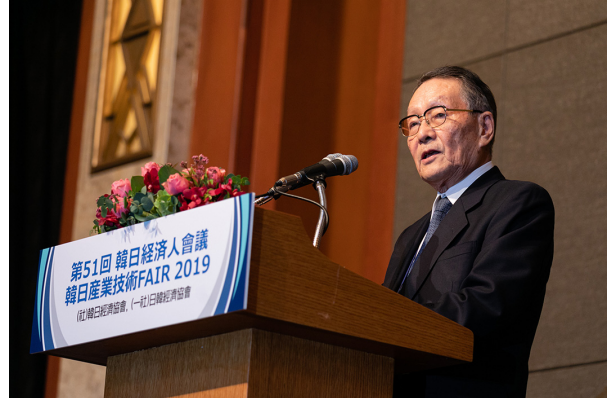
사사키 미키오 일한경제협회 회장