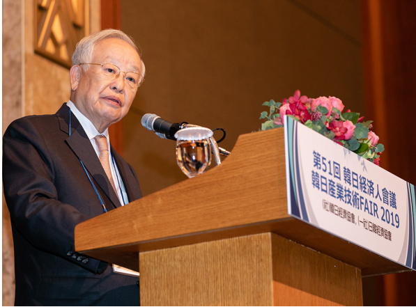
(기조연설) 손경식 한국경영자총협회 회장