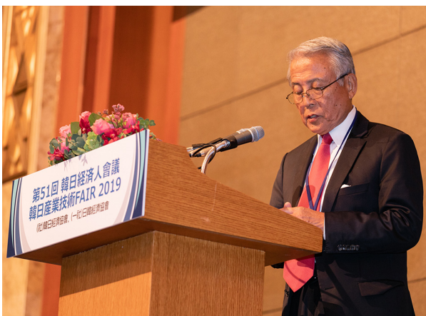
(한일신산업무역회의 경과보고) 아소 유타카 일본측 체어맨