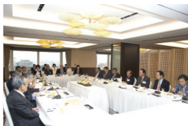
단장단 공동성명 심의