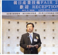
리셉션 서울시 환영사