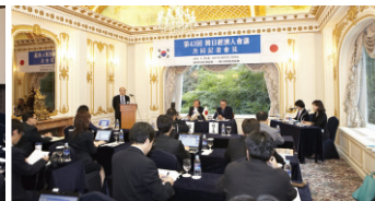
공동 기자회견 모습