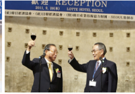
건배제의하는 양국 단장