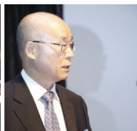
공동성명(안) 낭독하는 양국 전무