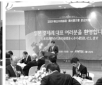
일본측 단장단 예방 (유명환 외교통상부 장관, 윤증현 기획재정부 장관, 이윤호 지식경제부 장관)