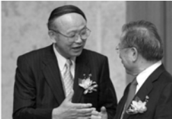
환담하는 양국 단장