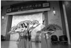
양국 공동주최 리셉션