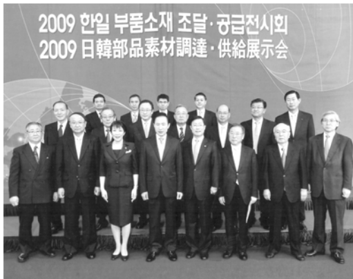
일본측 단장단 이명박 대통령 예방 후 전시회 방문