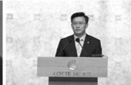
오세훈 서울시장 축하영상 소개