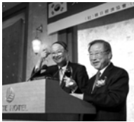
건배하는 양국 단장