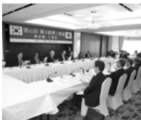
공동성명 심의하는 단장단