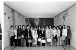
부인프로그램 (창덕궁 견학, 삼청각에서의 오찬회, 예술의 전당 '구스타프 클림트전' 견학)