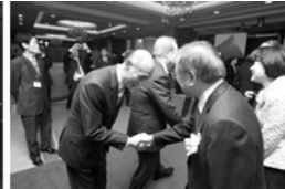
입례하는 양국 단장부부