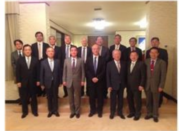
주한일본대사 주최 만찬