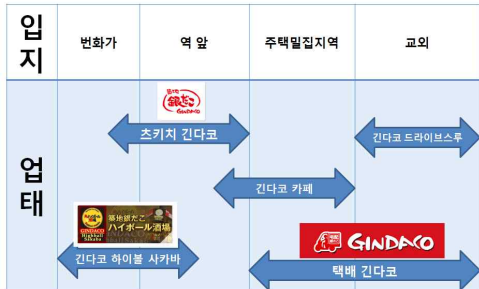
<그림3> 입지에 따라 업태를 변경하는 핫랜드의 출점 전략