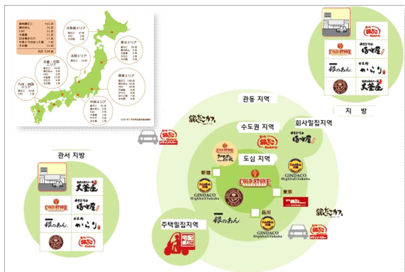
<그림1> Hotland의 일본국내 출점 현황