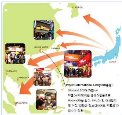
<그림2> Hotland의 해외 거점 현황